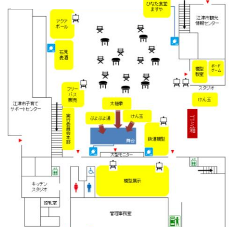
参考：第1回目レイアウト

ホビー祭りパスの収益金は、ごうつホビー祭りの運営費（施設利用料・広報料・備品料等）にすべて充てられます。余剰金が発生した場合は、全て翌年のホビー祭り運営費に回します